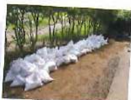
牧場に流れ込んだ土砂 至る所に土砂が...