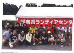
皆ご苦労様でした!

例えば献血。その血は自分の為ではなく「今必要な人」に使われます。また、自分に輸血が必要になった際には誰かの血を買っ払って貰います。年金も私達が払っているのは今の爺ちゃんお婆ちゃん達の為に使われています。そして、私達が年老いて働けなくなった時、今度は今の子供達が大人になり働いたお金で、年老いた私達の年金となる訳です。