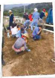
ひたすら掘って運びます

今回改めて「人の役に立てるといふのは、本心に気持ちのいい事である」という事を再確認した災害