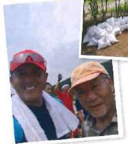
作業を終え、牧場主の方と