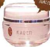
KAREN REVIVEジェル 30g 18,514円